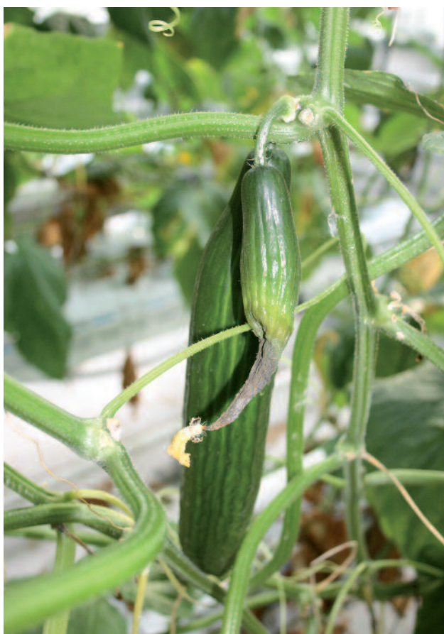
Mycosphaerella in komkommer

Frupica® , effectief tegen echte meeldauw, Botrytis en Mycosphaerella , is nu ook toegelaten in de teelt van courgette, komkommer, aubergine en tomaat. Het middel is zacht voor het gewas en heeft een veiligheidstermijn van 1 dag.